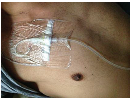
Photographie d'un cathéter

Ce dispositif peut rester en place plusieurs mois. Il permet, en plus de l'administration de médicaments, d'effectuer des prises de sang sans pique. Le cathéter est protégé par un pansement, que votre infirmière refera selon le protocole de l'hôpital. Au domicile, une infirmière libérale pourra venir effectuer ce soin 1 fois/semaine. Le cathéter ne doit pas être mouillé ou manipulé par un non professionnel du fait de risque d'infections entre autre.